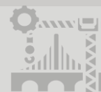
Distribuição dos investimentos previstos por setor da infraestrutura (em bilhões de reais; percentual)