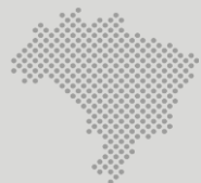
Distribuição dos investimentos previstos por região do país (em bilhões de reais; percentual)